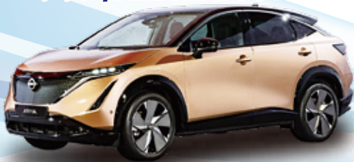
ニッサン/ARIYA B6(モーター・2WD)

車両本体価格 6,000,000円 <補助金適用価格> <補助金価格> 850,000円 5,150,000円