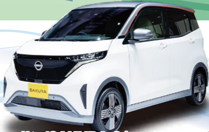
ニッサン/SAKURA G(モーター・2WD)

車両本体価格 3,040,400円 <補助金適用価格> <補助金価格> 550,000円 2,490,400円