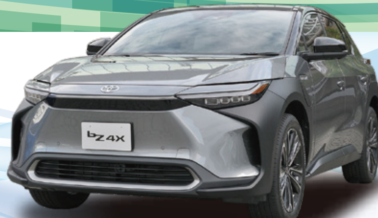
トヨタ/bZ4X Z(モーター・2WD)

車両本体価格 3,040,400円 <補助金適用価格> <補助金価格> 550,000円 2,490,400円