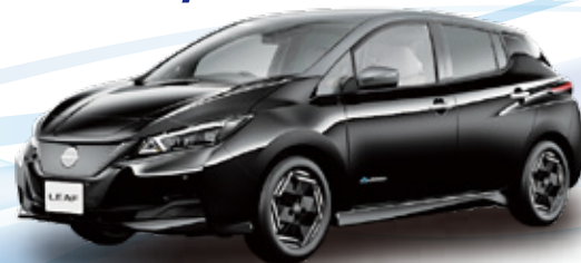
ニッサン/LEAF X(モーター・2WD)

車両本体価格 5,390,000円 <補助金価格> 780,000円 <補助金適用価格> 4,610,000円